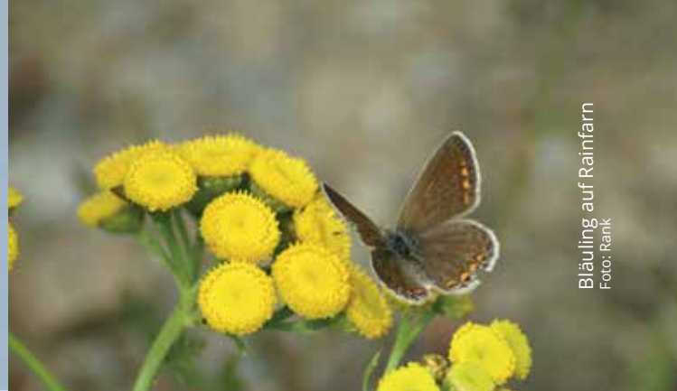
Bläuling auf Rainfarn