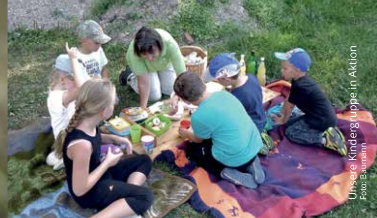
Unsere Kindergruppe in Aktion

„Jahreshauptversammlung“ Ein Rückblick mit Bildern aus dem Jahr 2018 und ein Ausblick auf das Jahr 2019. Alle Interessierten sind herzlich eingeladen! Gasthof Hauser, Holzhaus 1, Schwandorf