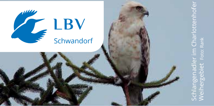
Schlangenadler im Charlottenhofer Wehrgelände